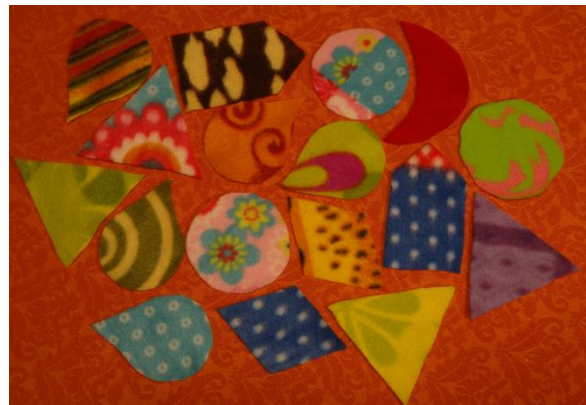
Beispiele verschiedener Formen aus Fleecestoff

Weiter unten findet ihr Vorlagen zum Herstellen verschiedener Formen in jeweils zwei Größen. Mit der größeren Schablone stellt man je eine Fleece- und eine Wachstuchform her.