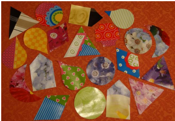
Beispiele verschiedener Formen aus Wachstuch

Im Baumarkt habe ich noch je einen halben Meter von zwei verschiedenen Wachstuch Tischdecken von der Rolle gekauft (zus. etwa 4 €). Außerdem hatten wir auch noch einige Reste von Wachstuch mit anderen Mustern.