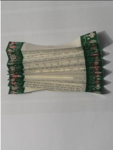
Liedblatt wie abgebildet für den Körper bekleben und falten.